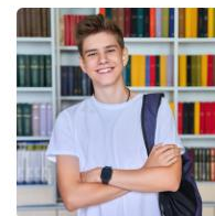
Rekrutacja do szkół ponadpodstawowych