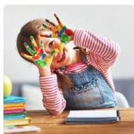
Rekrutacja do przedszkoli