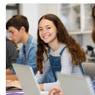
Rekrutacja do klas VII dwujęzycznych