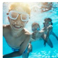
Rekrutacja do klas IV sportowych